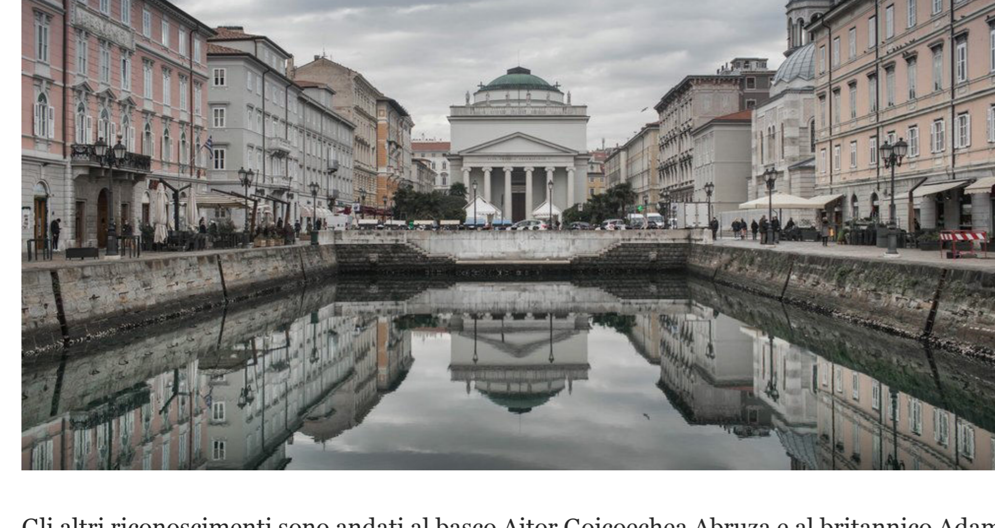
ITS tornerà ad organizzarsi in presenza nella città di Trieste (nella foto) in occasione della sua edizione 2022

Quest'anno il concorso ha scelto come tema “Costruire l'Arca” (Building the Ark), in riferimento alla “arca creativa” messa in risalto in questi 20 anni di attività. Ma il tema rimanda anche all'inaugurazione, che avverrà nel 2022, della “Accademia della creatività” quando l'evento triestino compirà 20 anni. La “ITS Arcademy” sarà aperta al pubblico e dedicata a formazione, incontri e mostre. Tutti i membri della famiglia ITS, tra ex finalisti, membri delle giurie e altre personalità, vi si potranno incontrare.