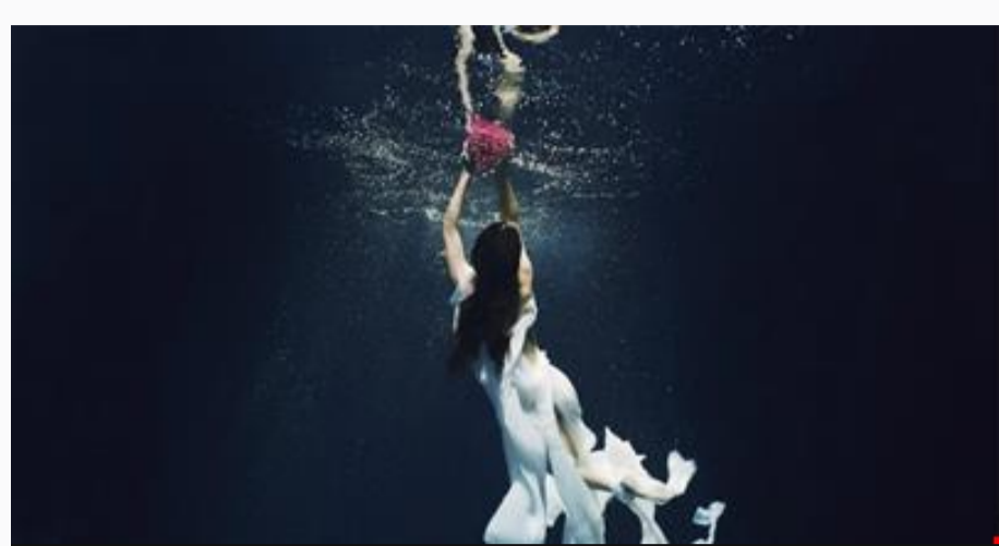
L'immagine di promozione di Its Contest 2022