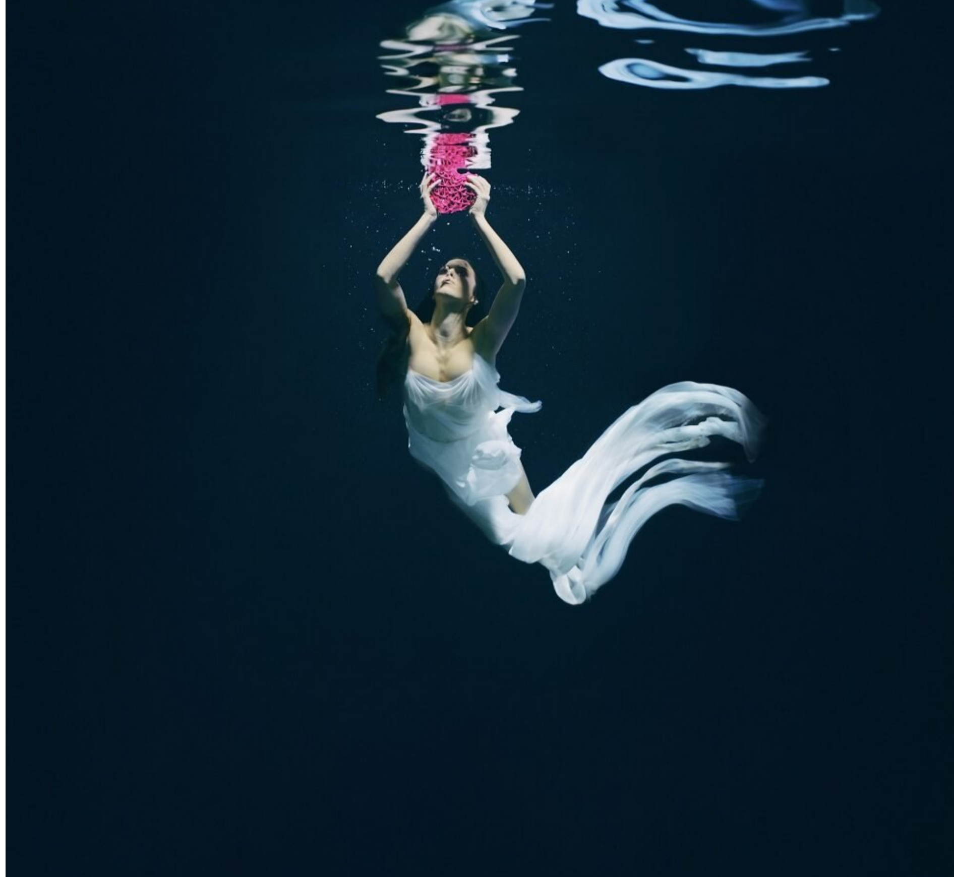
ITS compie 20 anni e inaugura la sua "Arcademy"