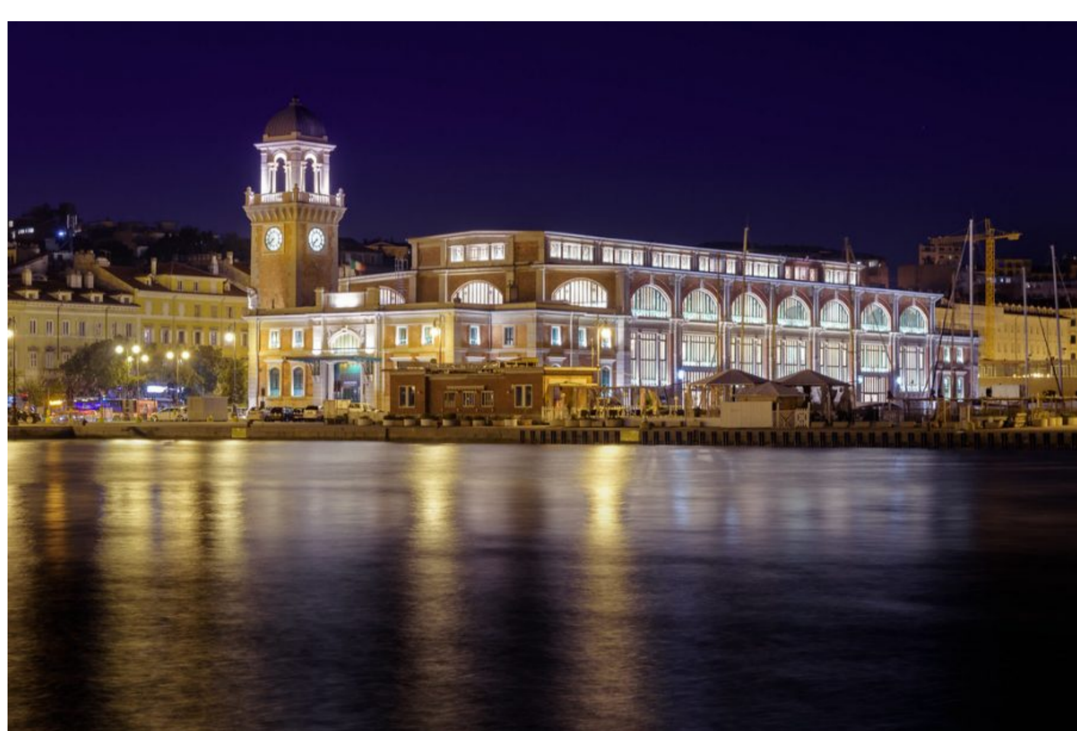
Salone degli incanti in Trstu