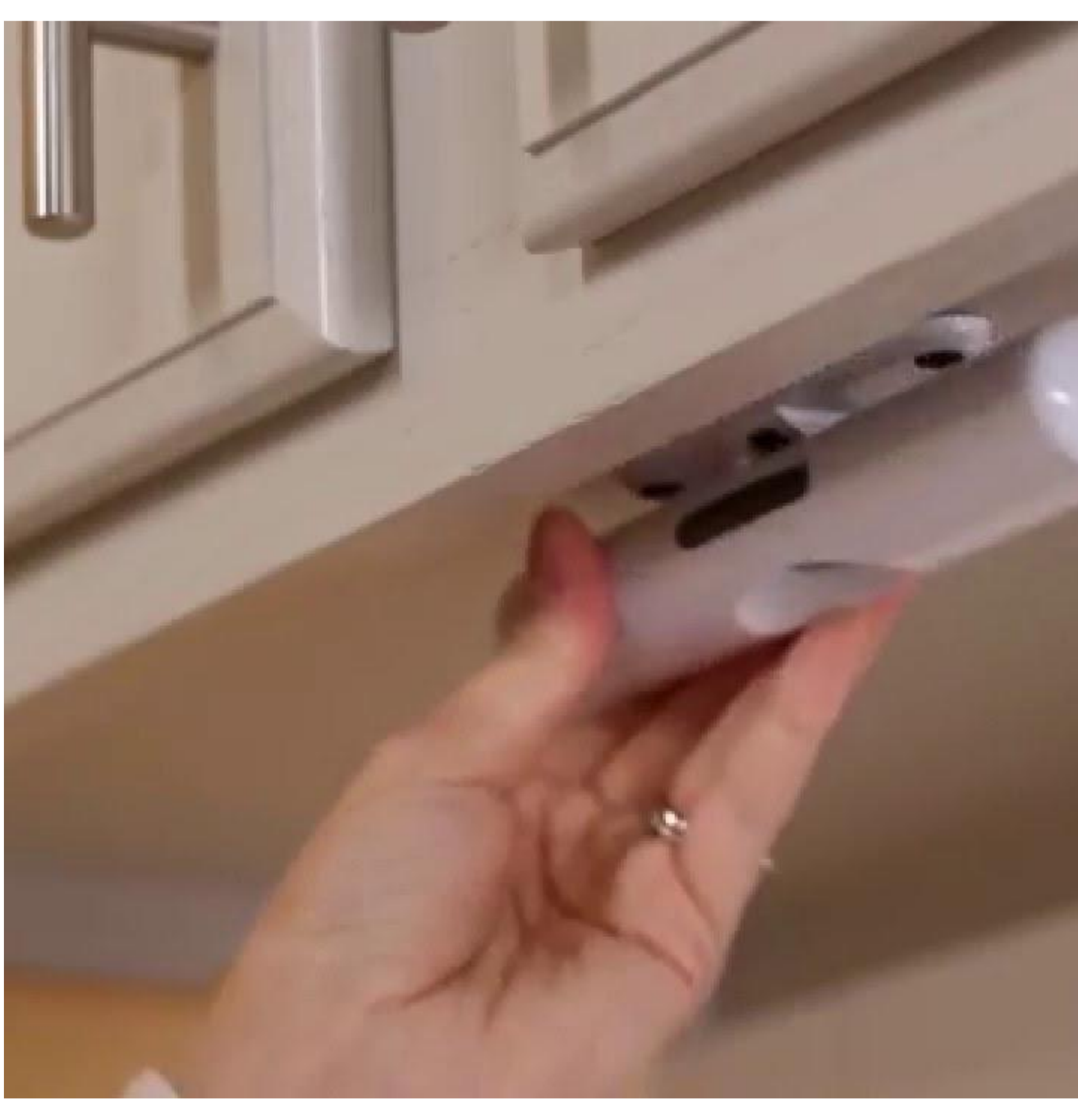
Come sistemare cucina buia